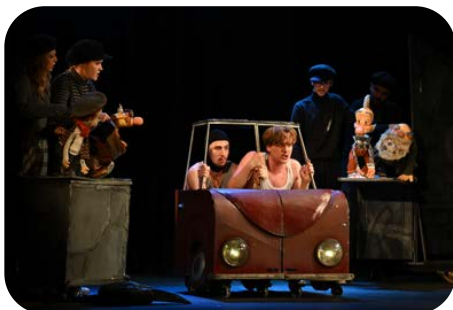
Наградата се присъди на спектакъла „Маншон, Полуобувка и Мъхеста брада“ на Младежки театър „Николай Бинев“ - София