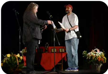
Куклен и младежки държавен театър - Батуми, Грузия