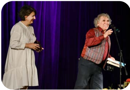
Куклен театър „Темпо“ - Анкара, Турция

ДИПЛОМ ЗА ИНТЕГРАЦИЯ И МЕЖДУНАРОДНИ ОТНОШЕНИЯ се присъди на: